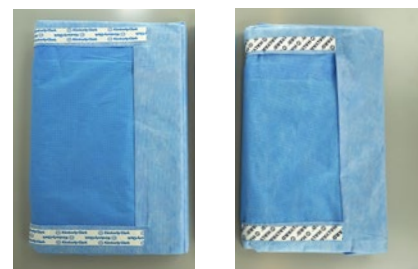
Film antiadhésif sur les champs : passage du logo K-C au logo Halyard

Pour toute question, rendez-vous sur la page : www.halyardhealth.fr/changecommunications .