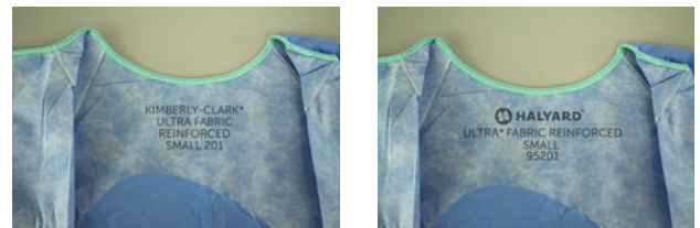
Marquage avec code, à l'intérieur de la casaque : passage de Kimberly-Clark à Halyard

Les logos, étiquettes, emballages et documents de l'ensemble de notre gamme de produits Chirurgie – casques, champs, trousse, champs pour appareils et accessoires – figure la marque Halyard, et non plus Kimberly-Clark.