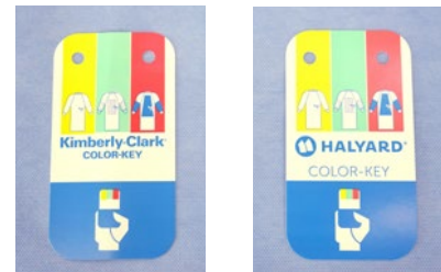
Carte de transfert pour casaque chirurgicale : passage de logo K-C au logo Halyard