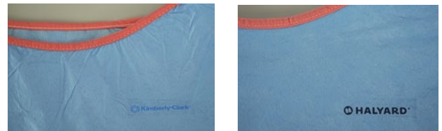
Logos sur les casques chirurgicales : passage de Kimberly-Clark à Halyard